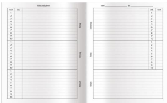
Hausaufgabenheft zum Vortragen